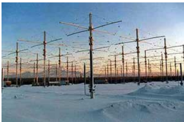
Las antenas del programa HAARP.