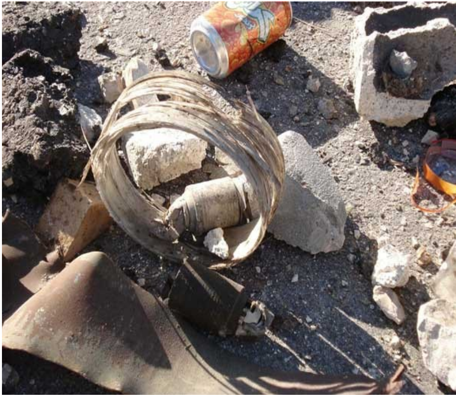
Foto: bomba de fragmentación.

1999- EEUU reconoce que está formando un grupo para manipular la opinión pública internacional respecto a su política exterior (33).