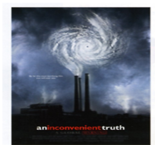
Foto: una verdad inconveniente.

Al Gore permíteme hacer una reflexión: no hay quién se crea que por la muerte de unas personas te preocupes y por las de otras no. Sólo te preocupas de ti y de tu insaciable ambición de poder. Que sepas que no nos confundes y que los que creemos que el espíritu y la ciencia tienen que andar de la mano leemos entre líneas los olvidos, los desvíos y falta de atención, dimensionamos los asuntos por orden de importancia, olfateamos lo oportuno y lo inoportuno del momento y sólo podemos entender el presente con una visión global no fraccionada.