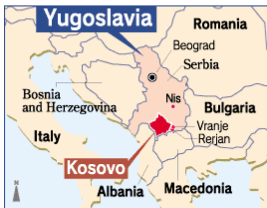
Foto: Mapa de Yugoslavia.