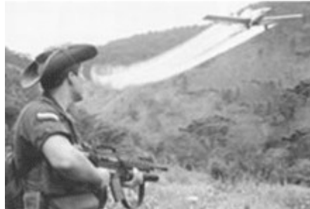
Foto: Colombia fumigación aérea

en África, va mal. Las ventas del tóxico AZT se rechazan, e incluso la propia hipótesis oficial de que el SIDA esté causado por un virus es cuestionada. En enero Al Gore preside una reunión excepcional del Consejo de Seguridad de la ONU sobre el problema del SIDA en África. Pero en realidad, sobre la amenaza del creciente cuestionamiento de la hipótesis oficial en África. En mayo EEUU amenaza a Sudáfrica declarando que el SIDA en África es una amenaza para la seguridad nacional de los EEUU (35).