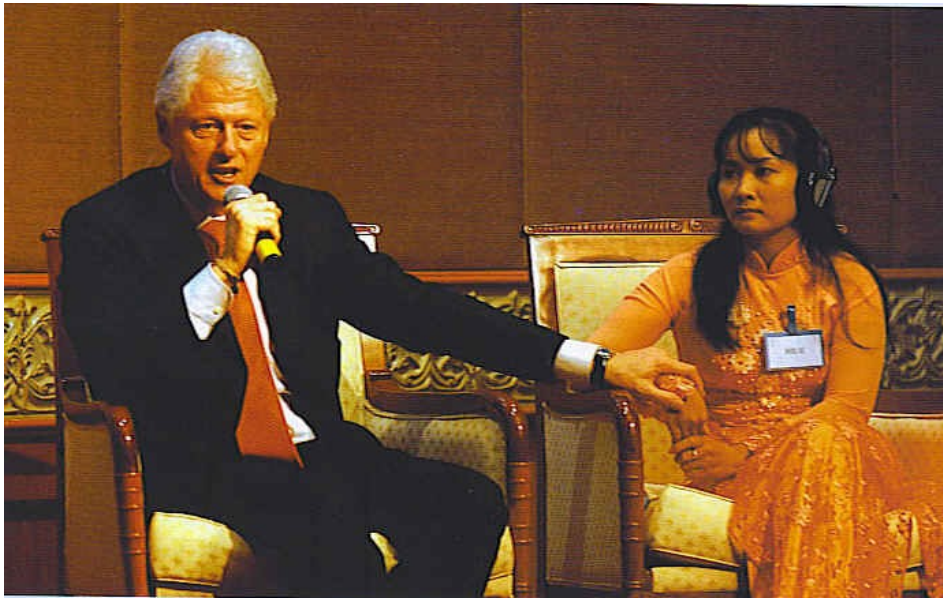
Foto: Clinton dando la manita a una vietnamita en su cruzada del SIDA

TIMOR ORIENTAL, 1999. Estados Unidos sigue apoyando con ayuda militar la masacre que perpetra el ejército indonesio sobre la población que reclama la independencia (34).