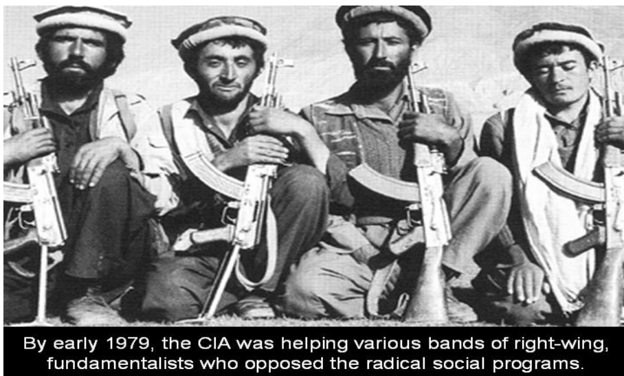
By early 1979, the CIA was helping various bands of right-wing, fundamentalists who opposed the radical social programs.