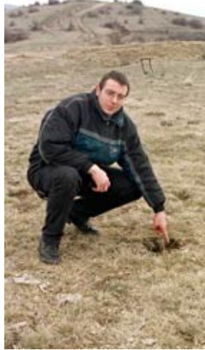
Foto: Projectiles sin explotar Serbia.

Y lo que queda ya que las consecuencias de la radiactividad seguirán estando presentes para siempre.