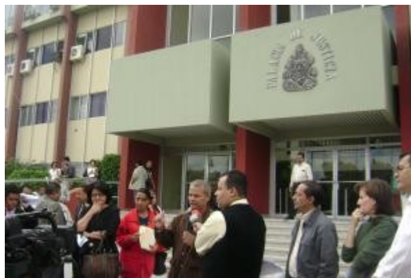
Miembros de la Plataforma de Derechos Humanos

La Plataforma de Derechos Humanos conformada por El Centro de Derechos de la Mujer (CDM), El Centro de Investigación y Promoción de Derechos Humanos (CIPRODEH), El Comité de Familiares Detenidos y Desaparecidos de Honduras (COFADEH), El Comité para la Defensa de los Derechos Humanos en Honduras (CODEH), El Centro de Prevención, Tratamiento y Rehabilitación de las Víctimas de la Tortura y sus Familiares (CPTRT).