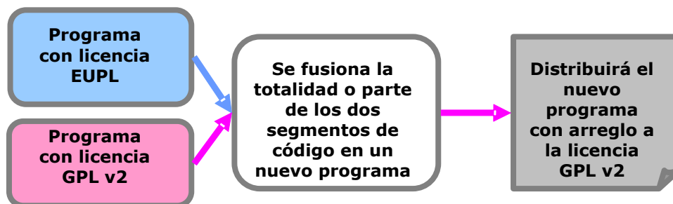
Ilustración 2: Cláusula de compatibilidad

redistribuirla conforme a las condiciones de la GPLv2, pues así lo exige esta licencia, que es « copyleft ». La EUPL resuelve el «conflicto de licencias» autorizándole a cumplir dicha obligación.