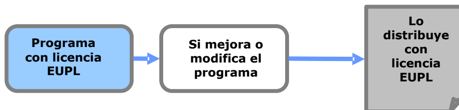
Ilustración 1: Efecto copyleft

Si usted ha creado una obra derivada (lo que quiere decir que ha modificado el programa de ordenador, añadido funcionalidades, traducido la interfaz a otra lengua, etc.) y distribuye esta nueva obra, también debe aplicar la misma licencia EURL (sin modificar sus condiciones) a la obra derivada final.