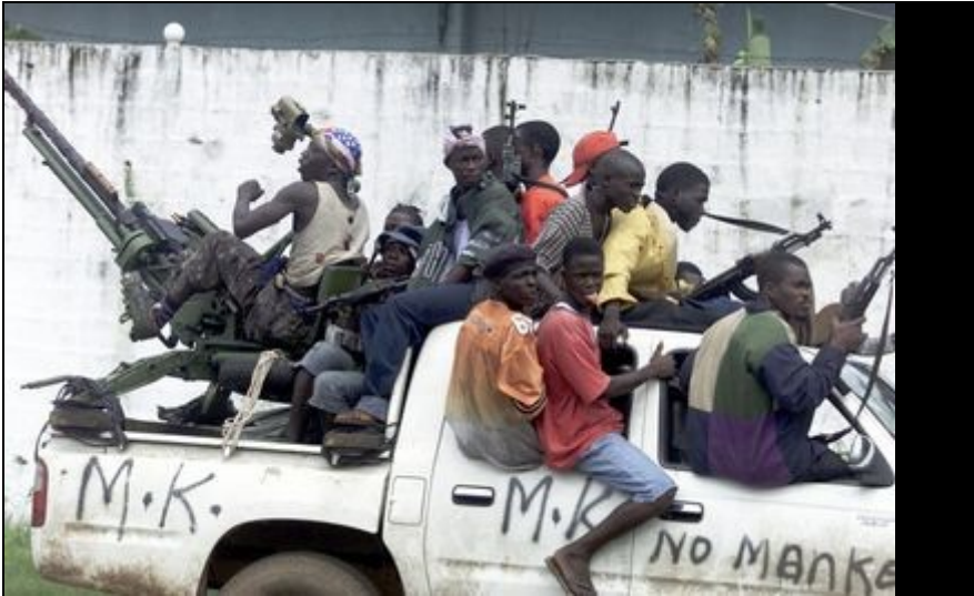
Soldados rebeldes en un patrullaje por calles de la ocupada ciudad de Monrovia, Liberia

Los gastos militares en el mundo alcanzaron un nuevo récord en 2005, al llegar a un billón 118 mil millones de dólares; y el primer consumidor de armamento fue Estados Unidos, con 48 por ciento de lo invertido a nivel mundial , indicó este lunes un informe del Instituto Internacional de Investigación para la Paz (SIPRI), con sede en Estocolmo.