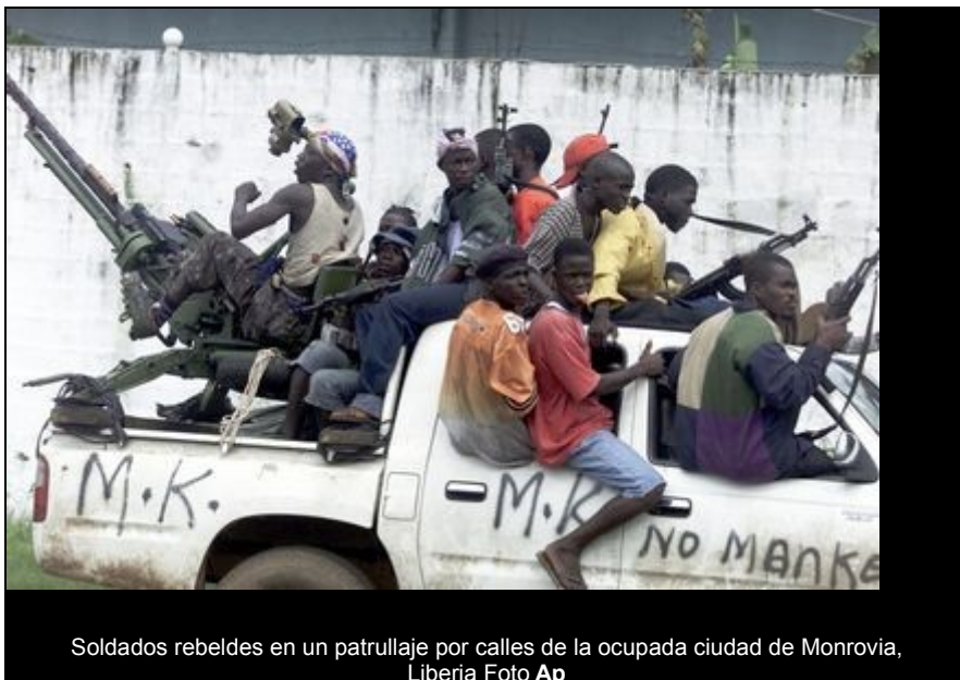
Soldados rebeldes en un patrullaje por calles de la ocupada ciudad de Monrovia, Liberia

Los gastos militares en el mundo alcanzaron un nuevo récord en 2005, al llegar a un billón 118 mil millones de dólares; y el primer consumidor de armamento fue Estados Unidos, con 48 por ciento de lo invertido a nivel mundial , indicó este lunes un informe del Instituto Internacional de Investigación para la Paz (SIPRI), con sede en Estocolmo.