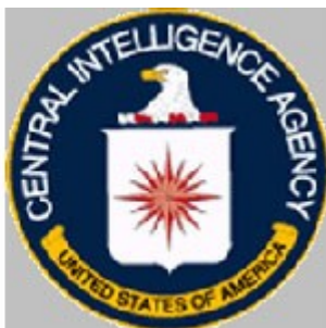
William Colby (1920-1996). Director de la CIA murió de manera misteriosa cuando pescaba en su bote después de que se jubiló de la CIA.

Rastrear la historia de la creación y formación del más secreto de los servicios secretos no sólo