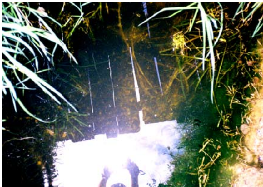
Foto 28: Entrada a la parroquia San Juan-Gualaceo. Charco de agua y matorrales bajo un puente viejo de madera.