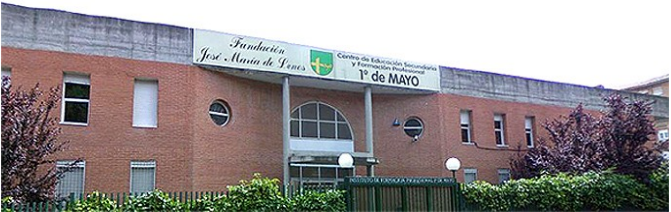
Centro de Educación Secundaria y formación profesional 1º de Mayo

Al día de hoy, seis décadas después de iniciar los primeros trabajos en el Pozo del Tío Raimundo (y Entrevías), la obra llevada cabo por el jesuita y vecinos y vecinas del barrio sigue contando con grandes retos. Como ocurriera hace 60 años, la inmigración es la punta de lanza de la nueva acción social. Ya no son habitantes jienenses de Martos y de otras poblaciones andaluzas, extremeñas o manchegas los que año tras año llegan al barrio sino marroquíes, latinos y personas de otros países que buscan un futuro mejor en nuestro país. En este sentido y siguiendo las aspiraciones iniciales del proyecto, la Fundación del Padre Llanos cuenta con el centro de formación del 1º de Mayo, en la calle Los Barros y la Escuela de Hostelería de Sur-recién remodelada- en la calle Martos, donde se desarrollan los trabajos de apoyo a inmigrantes y concienciación social para los vecinos sobre el tema de la inmigración.