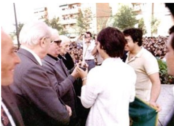
El Padre Llanos junto a "La Pasionaria" y el alcalde socialista Tierno galván en el barrio del Pozo.