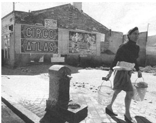
Una fuente pública. Años 60.

En los primeros años de apostolado, el Padre Llanos se rodeó de personalidades importantes