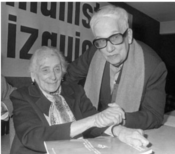
El Padre Llanos junto a la mítica líder comunista española "La Pasionaria".