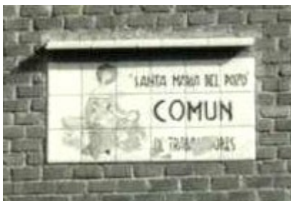
Placa indetificativa de Santa María del Pozo Común de Trabajadores.

Así, mientras se ganaba el respeto y la confianza de las clases obreras y los movimientos de izquierda, perdía ambos de sus antiguos camaradas falangistas y hermanos de fé. Tanto la Falange, que se mantenía en sus principios, como el sector nacional católico y la propia Compañía de Jesús, no daban crédito a la deriva de este jesuita que ahora se mezclaba -y con afán de pertenencia- con aquellos que atacaban a la iglesia e ignoraba a los que siempre le prestaron protección. Estos aprecio y desprecios seguro que también sembraron algo de duda en el jesuita que finalmente, pese a todo, optó por la síntesis dialéctica de izquierda y cristianismo que él y otros muchos religiosos cristianos escogieron como modo y ejemplo de vida.