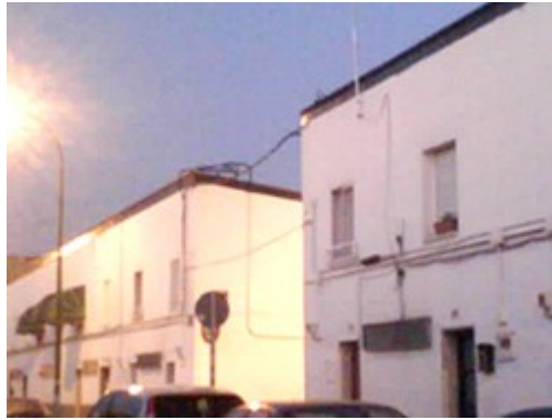
Foto izquierda: nueva escuela de formación de cocina y hostelería, en la Calle Martos.

Segunda foto: una parte del barrio del Pozo-Entrevías donde las casas y la vida social de barrio recuerda mucho a los pueblos.