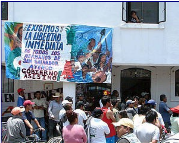
+ Concentración en San Salvador Atenco para exigir la liberación de los detenidos tras los acontecimientos de mayo de 2006

El 25 de enero de 2008 se presentó una querrela ante la Audiencia Nacional contra varios agentes de policía mexicanos y autoridades responsables por el delito de tortura en la modalidad de violencia sexual durante la represión de las protestas de una organización campesina en San Salvador Atenco, México, a principios de mayo de 2006. La denuncia fue interpuesta por una ciudadana española. La Fiscalía se opuso a la admisión de la querrela. Por su parte, las autoridades mexicanas informaron al Juzgado Central de Instrucción que se encontraban abiertas causas en ese país por los hechos de San Salvador Atenco. Sin embargo, no informaron de las personas que estaban siendo investigadas, ni los delitos por los que se estaba investigando, y tampoco sobre la existencia de alguna investigación por lo ocurrido a la víctima española. Aún así, el Juzgado de Instrucción decidió denegar la admisión de la querrela considerando que había quedado suficientemente demostrada la actividad efectiva del Estado territorial, en este caso, el Estado mexicano.