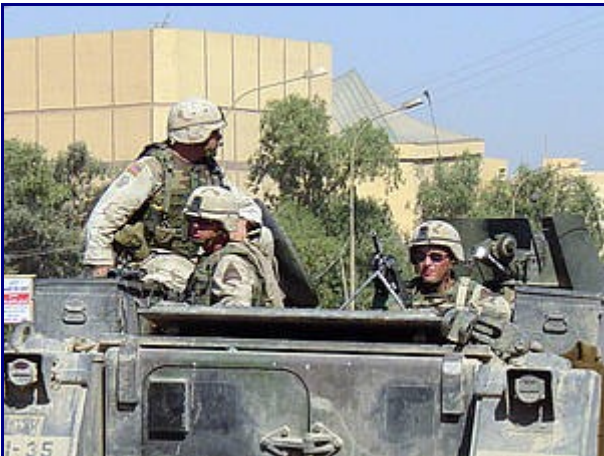
+ Soldados de EE.UU. patrullando en Karrada Kharij, Bagdad. 27 de julio 2003.