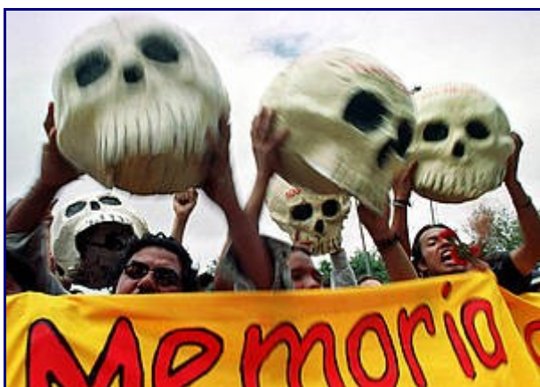
+ Un grupo de manifestantes portando cráneos durante el Día del Ejército en la ciudad de Guatemala, 30 de junio de 2000.