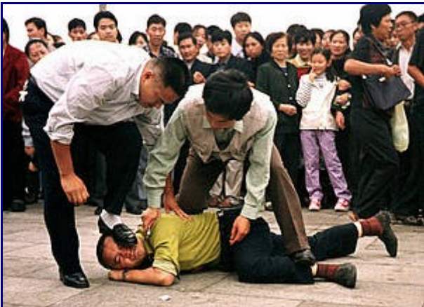
+ La policía detiene a un manifestante de Falun Gong en la Plaza de Tiananmen. Beijing, 1 de octubre 2000.

El 15 de octubre de 2003, quince víctimas interpusieron una querrela criminal contra miembros del Partido Comunista Chino por las torturas, persecución y genocidio cometidos en China desde el año 1990 contra practicantes de la enseñanza religiosa Falun Gong. Actualmente existe un total de cuatro querellas acumuladas y finalmente admitidas a trámite en la Audiencia Nacional contra el ex presidente Jiang Zemin y los miembros del partido Luo Gan, Jia Qinglin y Wu Guanzheng. Las cuatro querellas fueron inicialmente denegadas a trámite pese a la absoluta inactividad e inefectividad de las acciones interpuestas por las víctimas ante los juzgados chinos. El Ministerio Fiscal se opuso a todas ellas.