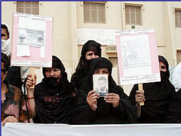
+ Manifestación de familiares de víctimas de desaparición forzada en El Aaiún, Sáhara Occidental, mayo de 2002.

El 14 de septiembre de 2006 se presentó una querrela contra 13 personas (gobernantes, militares y otras autoridades marroquíes responsables del mantenimiento del orden en el territorio del Sahara Occidental) por un delito de genocidio, en concurso con asesinatos, lesiones y torturas, contra ciudadanos saharauis entre 1976 y 1988. Fue admitida a trámite en octubre de 2007. Se realizó una diligencia (comisión rogatoria) ante las autoridades judiciales del Reino de Marruecos para saber si los hechos que se recogían en la querrela fueron o están siendo investigados y conocer el resultado de la investigación. Desde entonces se han practicado diferentes declaraciones testificales de víctimas denunciando de los delitos, principalmente de víctimas de tortura.