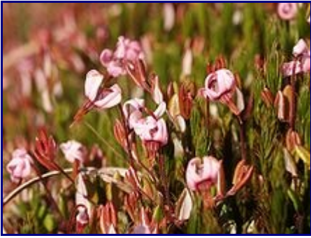
Flores de Vaccinium oxycoccus .

El arbusto del arándano rojo es bajo, con tallos de 10 cm o menos, con tallos finos y pequeñas hojas perennes. Las flores son de color rosa oscuro, con distintivos pétalos "reflejados" que dejan el estilo y los estambres completamente expuestos, apuntando hacia delante. El fruto es una baya auténtica de tamaño superior al de las hojas. Es inicialmente blanco, pero se vuelve rojo intenso al madurar. Es comestible, con un sabor ácido que puede enmascarar su dulzor.