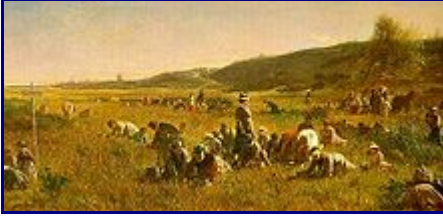
La Cosecha de Arándano rojo en la isla de Nantucket, Eastman Johnson, 1880.

El arándano rojo ha formado parte de la dieta de los pueblos árticos durante milenios, y sigue siendo un fruto muy popular en Escandinavia y Rusia . En Escocia las bayas eran recolectadas en arbustos silvestres, pero la pérdida de hábitats adecuados ha hecho las plantas tan escasas que ya no se encuentran. En el este de Norteamérica, los amerindios utilizaban los frutos del Vaccinium macrocarpon como alimento siendo uno de los ingredientes principales del alimento de supervivencia llamado pemmican . Se sabe que se los enseñaron a los famélicos colonos ingleses en Massachusetts alrededor de 1620, por lo que el arándano rojo fue incorporado a la tradicional fiesta del Día de Acción de Gracias .