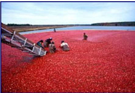
Cosecha de arándanos rojos en Nueva Jersey.

El arándano rojo es un importante cultivo comercial en varios estados de Estados Unidos y en varias provincias canadienses . También en el sur de Chile y de Argentina , en los Estados bálticos y en Europa Oriental existen pequeñas áreas de producción.