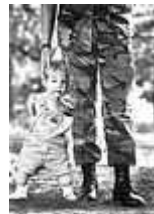
Hijo de un veterano del Golfo