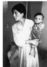
Aumento de casos de poliomelitis