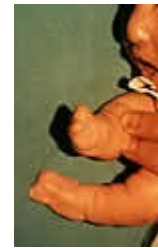
Anomalías en manos y pies