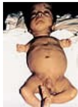
Niño iraquí malformado