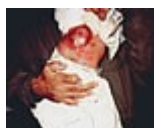
Espina bífida y fisura innata