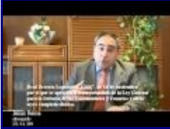
8:59 6/10 - La Gripe A o EL MARKETING DEL MIEDO