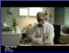
10:09 4/10 - La Gripe A o EL MARKETING DEL MIEDO