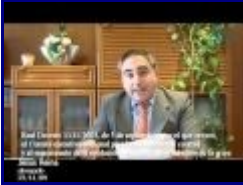
10:13 5/10 - La Gripe A o EL MARKETING DEL MIEDO