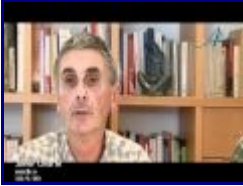
7:11 8/10 - La Gripe A o EL MARKETING DEL MIEDO