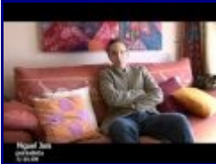
10:34 9/10 - La Gripe A o EL MARKETING DEL MIEDO