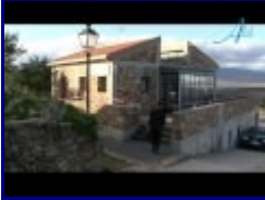
9:55 4/5 - JUAN GERVAS - ENTREVISTA