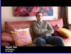
6:37 7/10 - La Gripe A o EL MARKETING DEL MIEDO IALISH