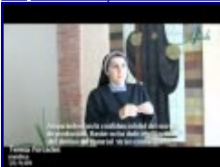
7:46 2/10 - La Gripe A o EL MARKETING DEL MIEDO 1ALISH