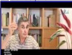
10:16 3/10 - La Gripe A o EL MARKETING DEL MIEDO