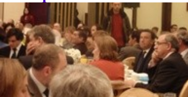
Asistentes al acto.

Asimismo, todos los colectivos se han posicionado a favor de que desde las distintas Administraciones y los distintos agentes se alcancen acuerdos que faciliten un abordaje integral y multilateral de los problemas de la sanidad española", al tiempo que han pedido despolitizar el sistema y darle al Consejo Interterritorial del SNS potestad para promover modelos de gestión equitativos, coordinando, cooperando y comunicando la Administración del Estado con las Comunidades Autónomas. En este sentido se considera, asimismo, necesario reclamar mayor liderazgo por parte del Ministerio de Sanidad a la hora de coordinar y dar mayor cohesión al sistema.