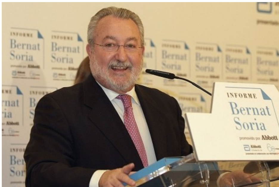
El ex ministro durante su presentación.