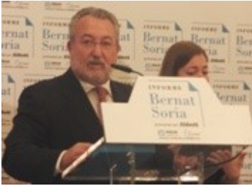
Momento de la intervención del ex ministro.

El SNS es percibido, en dicho informe, como uno de los grandes patrimonios de todos los españoles y, por ello, "estamos obligados a no hipotecarlo", según sus palabras. Sus virtudes: equidad, solidaridad y universalidad no eclipsan otros aspectos que deben ser abordados de manera consensuada, como son la sostenibilidad del sistema, las desigualdades entre Comunidades Autónomas, la eficiencia en la gestión y la capacidad de adaptación al paso del tiempo y a las nuevas circunstancias.