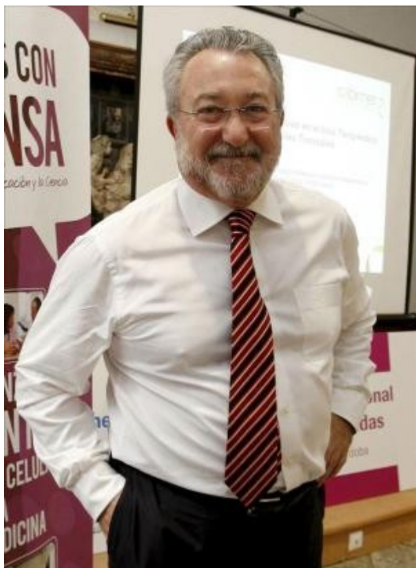
El exministro de Sanidad Bernat Soria.

El Informe Bernat soria, en el que han participado 35 expertos del ámbito sanitario, advierte del peligro de una "burbuja sanitaria" si no se adoptan ya medidas que garanticen la calidad y sostenibilidad del Sistema Nacional de Salud (SNS).