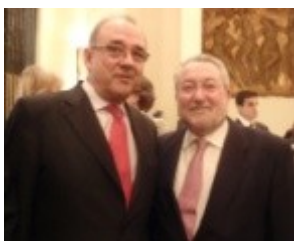
La OMC ha sido uno de los participantes en este informe.

Los pacientes deben quedar integrados en el sistema como un agente capaz de decidir, "ya que en la práctica con se le concede todavía la importancia que requiere, siendo muchas veces tratado como receptor de servicios", según queda reflejado en este estudio. Asimismo, consideran que hay que procurar minimizar las diferencias en la práctica clínica entre las distintas CC.AA., así como homogeneizar los protocolos de tratamiento entre los centros asistenciales de una misma autonomía.