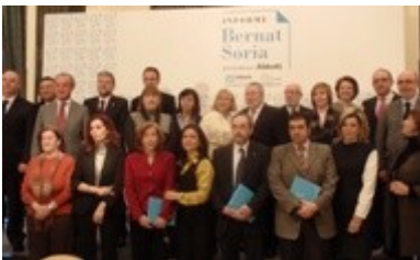
Representantes de todas las partes participantes en la elaboración del "Informe Bernat Soria".

Madrid, 2 de febrero 2011