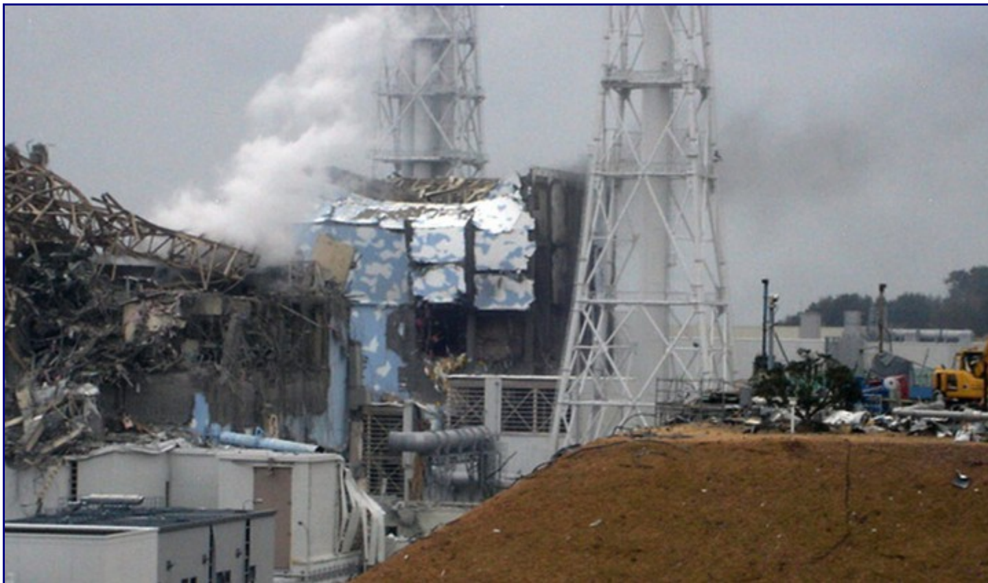
Estado de las unidades 3 y 4 de la central nuclear de Fukushima I el 16/03/2011.

>>> Última actualización sobre el estado de los reactores <<<