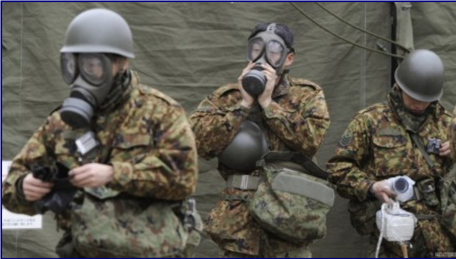
Soldados japoneses se protegen con máscaras para entrar a la zona afectada por los accidentes nucleares de Fukushima.