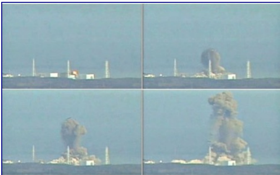
Explosión en la unidad 3 de Fukushima I

el caso no deberían ser tan potentes como las sucedidas en la central soviética. Eso significa menos diseminación de sustancias radioactivas y menos alcance de las mismas. Suponiendo que no nos encontremos con alguna otra sorpresa.