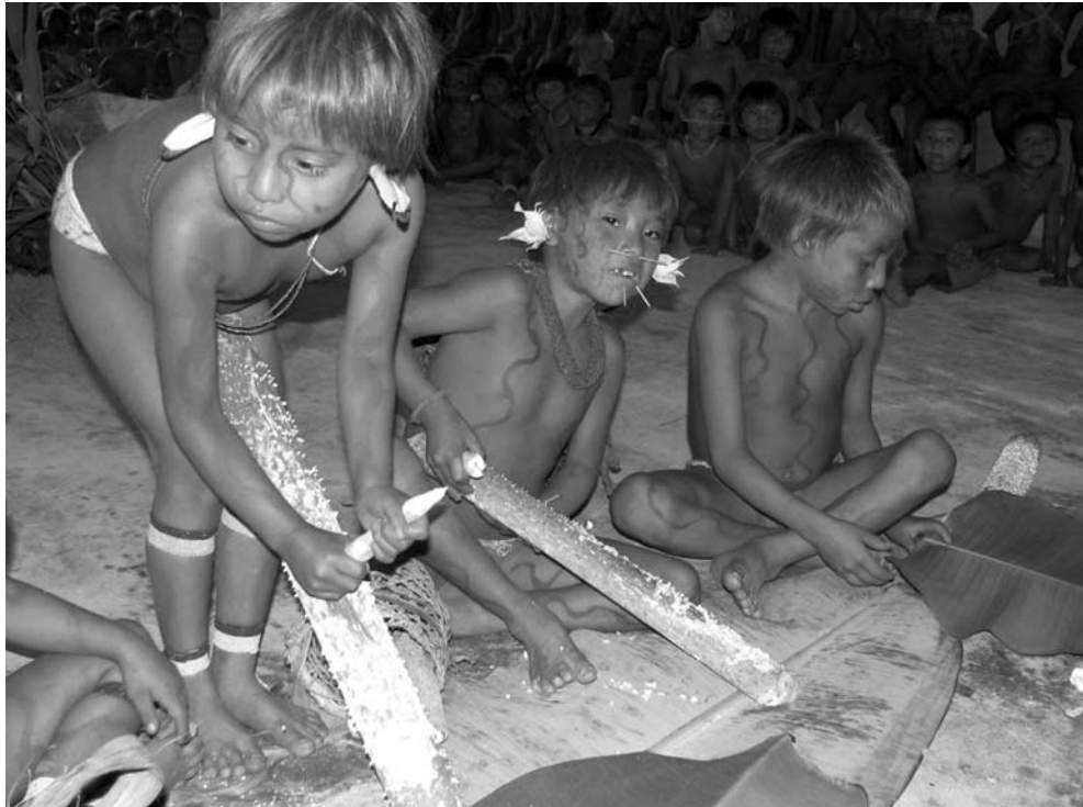
Yanomamis del Alto Orinoco