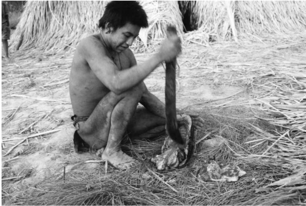
Hoti carneando una Tortuga, en Caño Mosquito