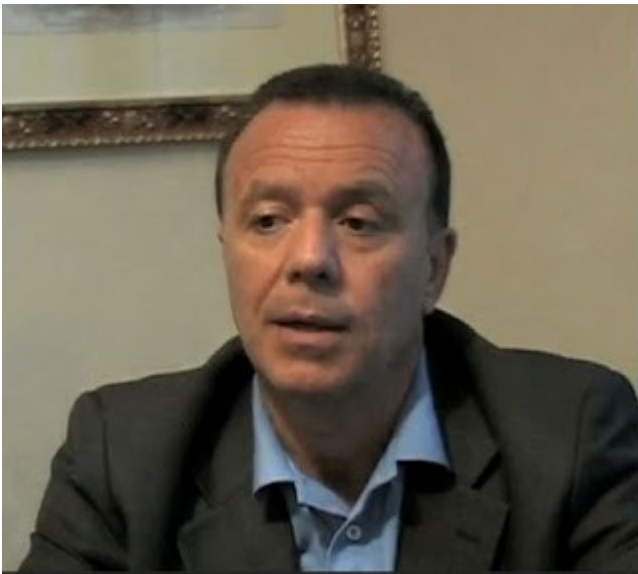
Dr Tulio Simoncini

El oncólogo italiano Tulio Simoncini sostiene que el cáncer es una enfermedad infecciosa provocada por hongos -concretamente por cándidas - y se cura aplicando de la forma adecuada simple bicarbonato sódico diluido en agua destilada porque basta alcalinizar la zona del tumor para contrarrestar el entorno ácido en el que se desenvuelve y detener así su crecimiento . Dilución que puede ingerirse pero también aplicarse por vía intravenosa y, en los casos más complicados, cuando se quiere llegar rápidamente cerca del tumor, utilizando los mismos métodos clínicos que se usan habitualmente para la exploración de cavidades y órganos. Para él los tumores no son en realidad sino mecanismos de defensa creados por el organismo para defenderse de la infección por esos hongos en un intento de encapsularlos y luego destruirlos. Lo que según él demuestra el hecho de que sea imposible observar en vivo un tumor -sea en la pleura, en los ganglios, en el colon, en el útero o en el hígado- sin encontrar siempre colonias de cándidas .