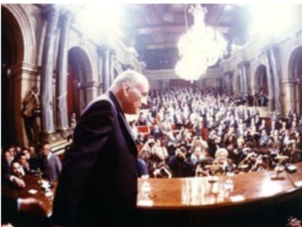
Foto de la sessió inaugural del Parlament restablert, celebrada el dia 10 d'abril de 1980. Arribada del president de la Generalitat provisional, M. H. Sr. Josep Tarradellas, per a presidir l'acte.

Durant el llarg període de la dictadura franquista (1939-1975) es van malmetre les aspiracions del poble català a l'autogovern. En el procés de restabliment de la democràcia a l'Estat espanyol, Catalunya va poder recuperar la Generalitat, amb caràcter provisional, amb el retorn, el 1977, del seu president a l'exili, Josep Tarradellas. Un cop aprovada la Constitució espanyola el 1978 i aprovat i referendat l'Estatut d'autonomia de Catalunya el 1979, la Generalitat restà restablerta de manera definitiva. Les primeres eleccions al Parlament de Catalunya restablert tingueren lloc el 20 de març de 1980 i la sessió constitutiva s'escaigué el 10 d'abril del mateix any.