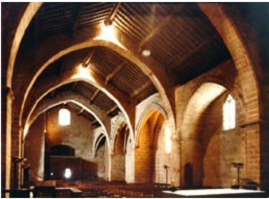
Interior de l'església de Sant Miquel, de Montblanc, on s'aplegaren les Corts diverses vegades durant el segle XIV i una vegada el segle XV.