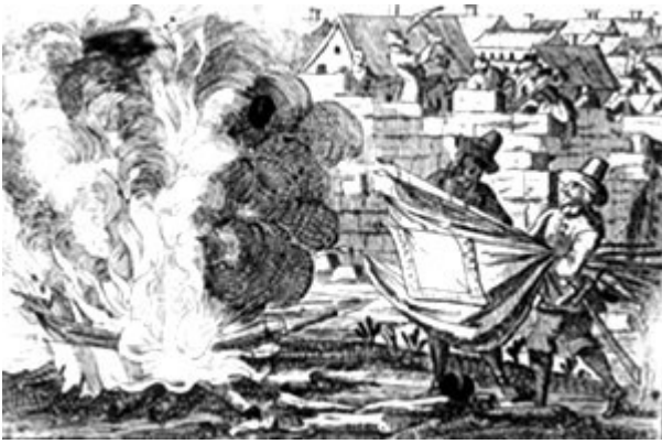
Gravat d'època que representa les tropes vencedores cremant les banderes de la Generalitat, després de l'ocupació de Barcelona el 1714. (Museu d'Història de la Ciutat, Barcelona.)

Durant el regnat de Jaume I el Conqueridor (1213-1276), la Cort comtal esdevingué Corts Generals de Catalunya en ampliar progressivament el nombre de membres convocats i, sobretot, en consolidar-se la incorporació de l'estament burgès, representat pels prohoms de viles i ciutats. Però el pas decisiu fou fet en el regnat del seu fill, Pere II el Gran (1276-1285), quan, en les Corts de Barcelona del 1283, mitjançant la constitució Volem, estatuim, es va establir el sistema de sobirania pactada característic del dret constitucional català medieval i modern. Segons aquest sistema, només eren vàlides les normes sorgides de les Corts per acord entre el sobirà i els estaments de la terra, fossin a iniciativa del primer (constitucions) o dels segons (capítols de cort). També havien de ser sancionades per les Corts les disposicions promulgades pel rei en l'interval en què les Corts no eren reunides (actes de cort, privilegis, pragmàtiques i altres drets). De fet, el rei renunciava a ser el poder legislador exclusiu.