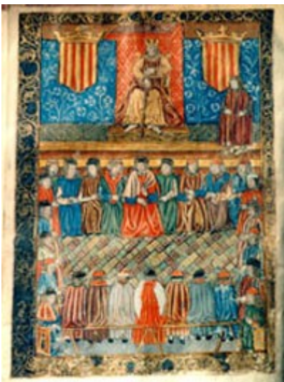
Boix que representa el rei Jaume I el Conqueridor (1208-1276) presidint una sessió de les Corts. (Incunable de les Constitucions de Catalunya. Arxiu de la Corona d'Aragó, Barcelona).