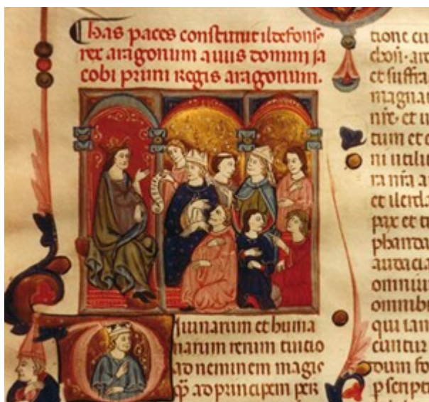
Miniatura que representa el rei Alfons I el Cast (1154-1196), presidint una assemblea de pau i treva (Còdex dels Usatges, Arxiu de la Paeria, Lleida.)