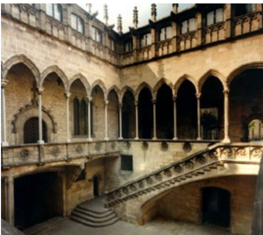
Pati central de la seu de la Diputació del General o Generalitat a Barcelona, palau construït entre els anys 1432 i 1439 pel mestre Lluís Safont. És també la seu de la Presidència i el Govern de la Generalitat instituïda el 1932 i restablerta el 1977.