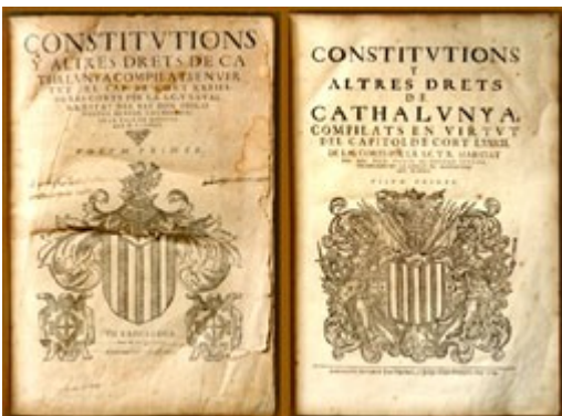
El dret català fou objecte de successives compilacions oficials acordades per les Corts. Portades de les compilacions editades el 1588 (esquerra) i el 1704 (dreta), que fou la darrera. (Institut Municipal d'Història, Barcelona.)