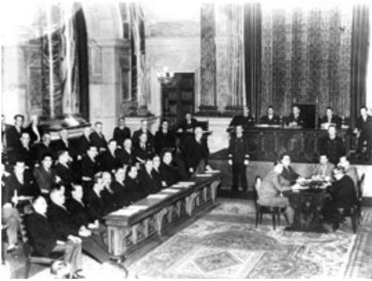
Foto de la sessió inaugural del Parlament de Catalunya, celebrada el dia 6 de desembre de 1932. A la presidència, el M. H. Sr. Lluís Companys; dret, al banc del Govern, el president de la Generalitat, M. H. Sr. Francesc Macià.

D'aquesta manera es reprenia la tradició parlamentària de Catalunya, interrompuda el 1714. Les primeres eleccions al Parlament de Catalunya van tenir lloc el 20 de novembre de 1932 i la sessió constitutiva s'escaigué el 6 de desembre del mateix any. El primer president del Parlament va ser Lluís Companys. El Parlament hagué de treballar en un context polític, tant català com espanyol i internacional, convuls; fou interromput durant dos anys, l'anomenat Bienni Negre (1934-1936) i, finalment, la mateixa institució parlamentària fou abolida, amb els altres òrgans de la Generalitat, pel triomf de la revolta contra la República espanyola (1939). Malgrat unes circumstàncies tan adverses, el Parlament, durant aquesta època, va fer una tasca legislativa important.