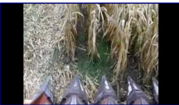
14:36 OGM, Alerta Mundial