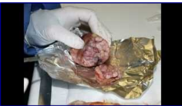
12:51 GMO, Global Alert

Investigadores franceses han realizado una investigación en secreto durante dos años, alimentando a 200 ratas con maíz transgénico. Éstas presentaron tumores y otros trastornos graves.