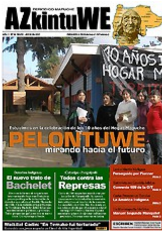
Nº 25- JUNIO DE 2007 (5 MG)