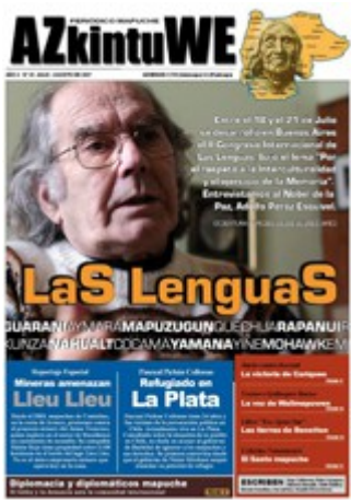
Nº 26- AGOSTO DE 2007 (6 MG)