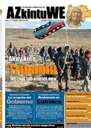
Nº 12 - MARZO DE 2005 (6.2 MG)