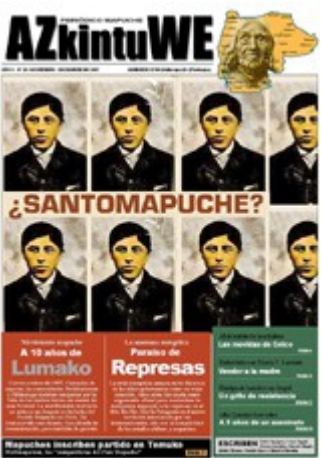
Nº 28- DICIEMBRE DE 2007 (12 MG)