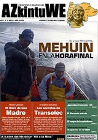
Nº 30 - MARZO DE 2008 (6 MG)