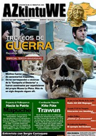
Nº 22 - NOVIEMBRE DE 2006 (6 MG)