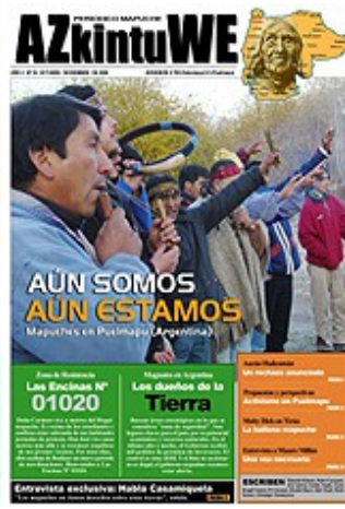
Nº 16 - NOVIEMBRE DE 2005 (6.2 MG)