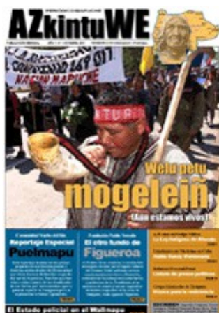
Nº 1 - OCTUBRE DE 2003 (6.2 MG)