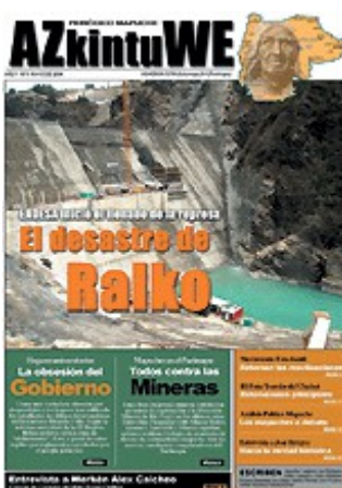
Nº 5 - ABRIL DE 2004 (6.2 MG)