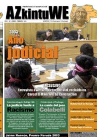
Nº 3 - FEBRERO DE 2004 (6.2 MG)