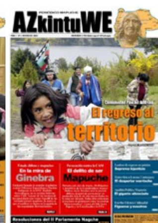
Nº 4 - MARZO DE 2004 (6.2 MG)