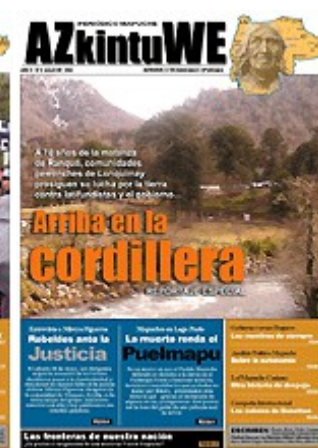
Nº 8 - JULIO DE 2004 (6.2 MG)