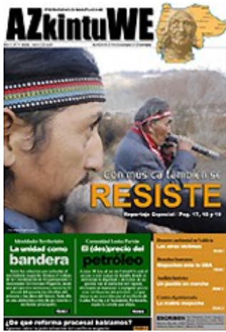
Nº 13 - MAYO DE 2005 (6.2 MG)