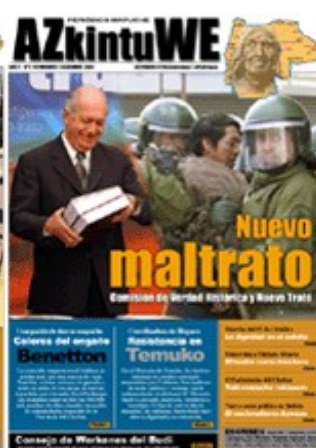
Nº 2 - DICIEMBRE DE 2003 (6.2 MG)