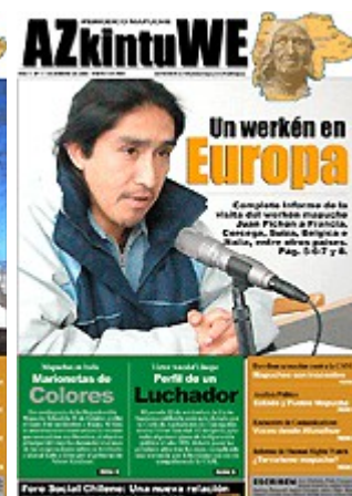
Nº 11 - ENERO DE 2005 (6.2 MG)