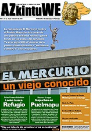
Nº 32 - AGOSTO DE 2008 (6 MG)