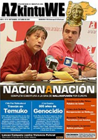
Nº 33 - OCTUBRE DE 2008 (6 MG)