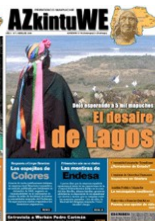
Nº 6 - MAYO DE 2004 (6.2 MG)