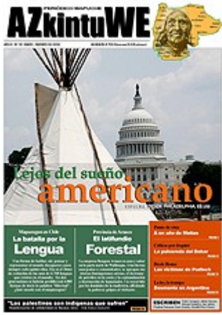
Nº 35 - FEBRERO DE 2009 (6 MG)