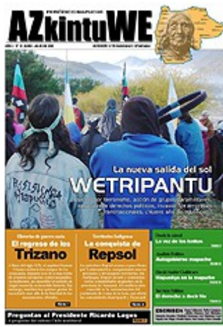
Nº 14 - JULIO DE 2005 (6.2 MG)