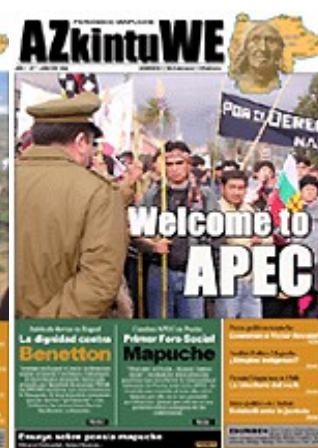
Nº 7 - JUNIO DE 2004 (6.2 MG)