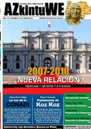
Nº 23 - ENERO DE 2007 (8 MG)