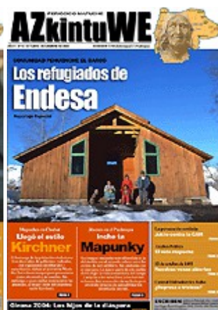
Nº 10 - NOVIEMBRE DE 2004 (6.2 MG)