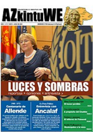
Nº 31 - JUNIO DE 2008 (6 MG)