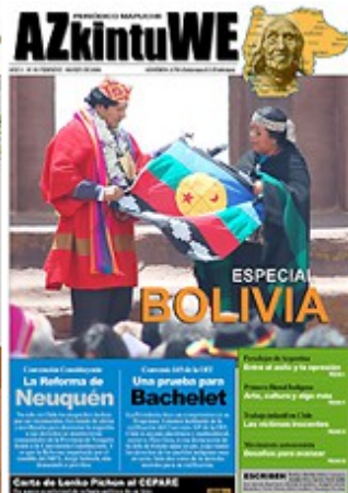
Nº 18 - MARZO DE 2006 (6.2 MG)