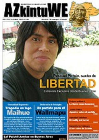
Nº 17 - ENERO DE 2006 (6.2 MG)