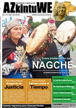
Nº 19 - MAYO DE 2006 (6.2 MG)