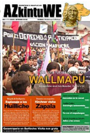
Nº 15 - SEPTIEMBRE DE 2005 (6.2 MG)