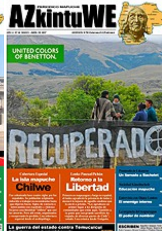
Nº 24 - ABRIL DE 2007 (5 MG)