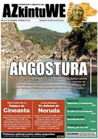
Nº 34 - DICIEMBRE DE 2008 (6 MG)