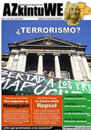
Nº 20 - JULIO DE 2006 (7 MG)