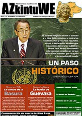
Nº 27- OCTUBRE DE 2007 (6 MG)