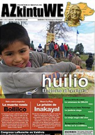
Nº 21 - SEPTIEMBRE DE 2006 (10 MG)