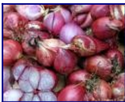
Allium cepa var. Aggregatum