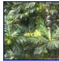
Artocarpus altilis var non-seminifera