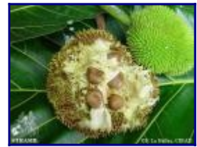
Artocarpus altilis var seminifera