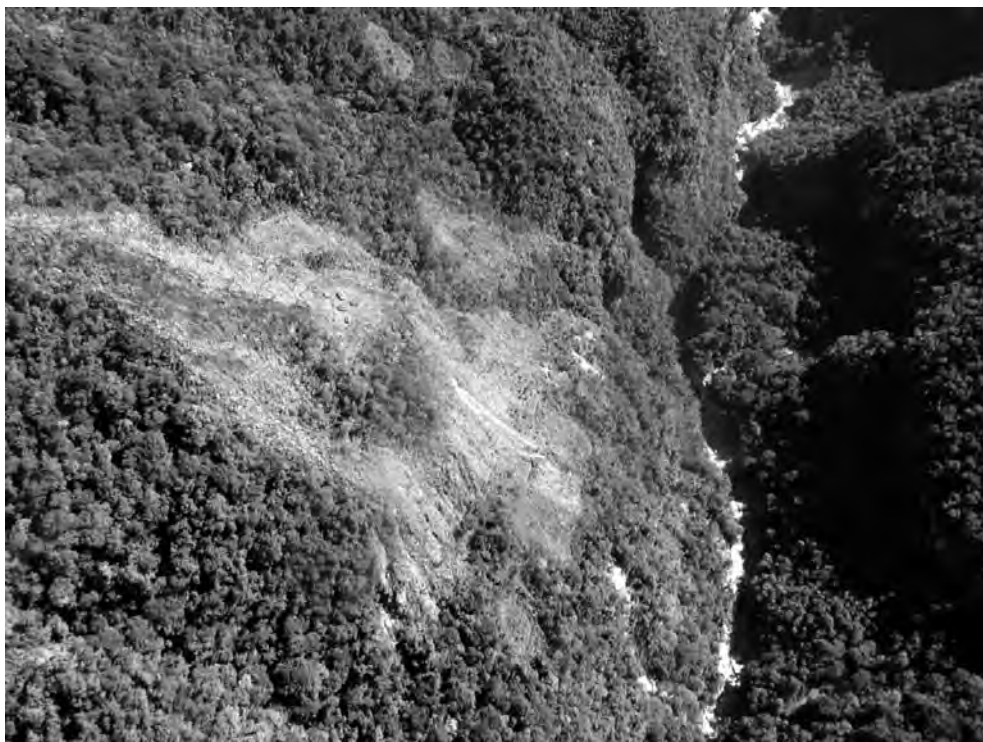
Asháninkas en aislamiento de la cordillera de Vilcabamba

tos Montetoni y Malanksiari ha estado expuesta a vejámenes sexuales y explotación laboral de parte de un profesor al que se le encargó el funcionamiento de la escuela establecida en el asentamiento Montetoni, tras el contacto. A la vez, como se ha visto, el proyecto Gas de Camisea ha tenido efectos negativos sobre su salud y los recursos naturales para su subsistencia. En este sentido, tal como lo señaló la OGE (2003) “Las potenciales amenazas sobre los Nanti son desproporcionadas para el tamaño poblacional de este pueblo indígena. Estas provienen de las actividades de extracción del gas, el deterioro de la base de recursos alimenticios río abajo; la incrementada actividad económica en la zona, y la movilidad de la población y personal de las empresas. Las amenazas actuales sobre las condiciones de vida de los Nanti se refieren tanto a su integridad física y derechos básicos, como a previsibles impactos inmediatos sobre la cultura y forma de organización bajo condiciones de interacción que no son igualitarias (192-193). Su territorio está comprendido en la Reserva Territorial Nahua, Nanti y otros, el Santuario Nacional Megantoni y el Parque Nacional del Manu.