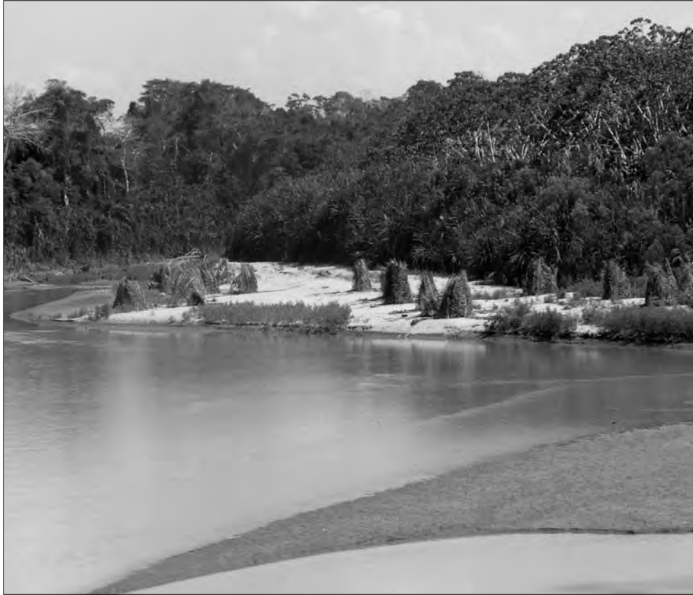
Viviendas temporales abandonadas por indígenas aislados