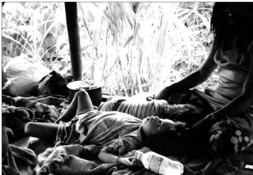
Niños Matsigenka en contacto inicial del Paquiría, enfermos por epidemias