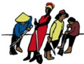
Las luchas del campesinado en el mundo